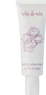
ニューフェアベルベットクリーム 【下地クリーム(日やけ止め)】50g 定価¥10,780(税込) (税別¥9,800)

「UV対策をするとお肌がカサつく…」そんなあなたにぜひ試してほしい、新発想のUV下地クリームです。水の代わりに フルーツ酵母発酵液 を68%も贅沢に使用。さらに ナイアシナミド や アミノ酸 豊富な温泉水など、厳選された美容成分が日中のお肌を乾燥から徹底的に守ります。デリケートなお肌のために、 紫外線吸収剤をカプセル化 。お肌に直接触れさせず、優しく紫外線をカットします。つけてる間ずっとスキンケアしているような心地よさで、みずみずしくやわらかなお肌を一日キープします。北海道・十勝の自然が育んだ プラセンタ や、希少な シラカバ樹液 、 極上の温泉水 など、こだわり抜いた天然由来の保湿成分がたっぷり。伸びのいいクリームがお肌にピタッと密着し、ツヤとハリのある上質な仕上がりへ。毎日のUV対策を極上の美肌ケアタイムに変えてみませんか？この下地クリームを塗っている間中、まるで美容液のバックをしているかのような贅沢な潤いで、夕方までツヤやかな上質肌をキープします。