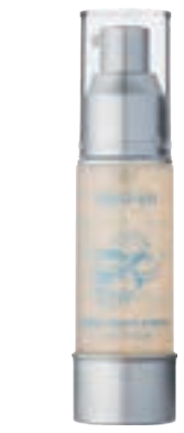
ジェントルサポートエッセンス 【美容液】35mL 定価¥16,500(税込) (税別¥15,000)

主成分には、お肌に驚くほど潤いと浸透力をもたらす「 フルーツ酵母発酵液 」を 50% (うち3倍濃縮フルーツ酵母発酵液を20%配合)も贅沢に配合。さらに北海道十勝の大自然の中で十勝産牛乳のホエイで育ったHACCP認定農場の豚の胎盤から得られた プラセンタエキス 、さらに美肌の湯として知られる「 北海道遺産モール温泉水 」など、厳選された大自然の恵みを凝縮しました。