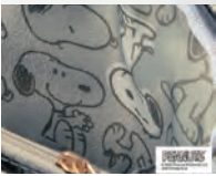
スヌーピーがいっぱいの プリント内生地が可愛い