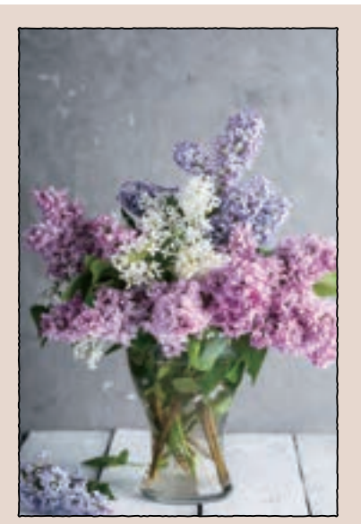
今月の表紙 新年度が始まり、少し肩の力が抜けない日々、せと寄り添うライラックのやさしい彩りを。今日も自分らしく、一歩ずつ、前へ。

2~3か月ごとにアイテムの変更を予定しております。お楽しみに！ ★当月40,000円(税別)以上購入の場合、ポイントを使用しご自分の購入%でビザビ商品が交換ができるサービスもあります！ ポイントと交換を希望の場合は本社までお電話ください！